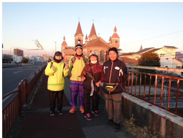
初の無観客での大会開催に。例年とは違った